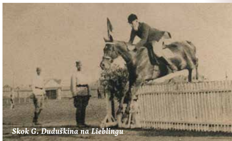
Skok G. Duduškina na Lieblingu

Na trećoj prepenci vidi da je vrag odnio šalu i odluči napokon napraviti kako ga je trener savjetovao. Pred preprekom glasno zaurla konju u uho - Ajdeee hoop! – i