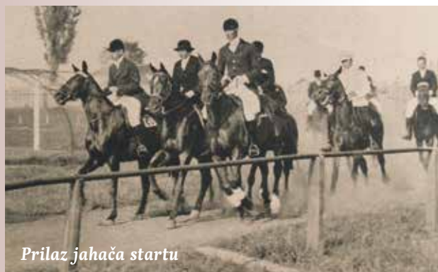
Prilaz jahača startu

U prvim desetljećima prošloga stoljeća, u Zagrebu su se konjička natjecanja održavala na stadionu nogometnog kluba HAŠK u Maksimiru ili na trkalištu u Prečkom